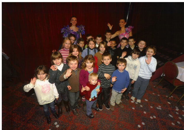
L'AVENIR DES ORMES